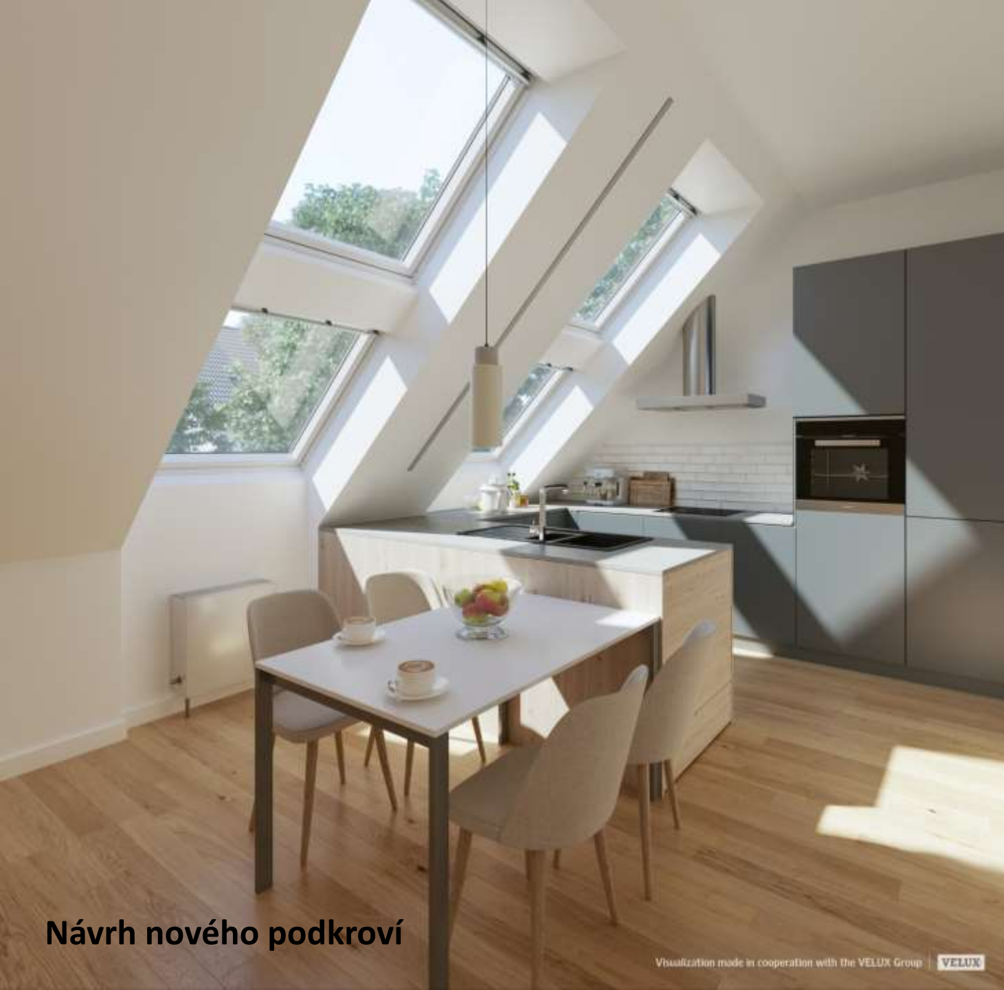
Návrh nového podkroví

Visualization made in cooperation with the VELUX Group | VELUX